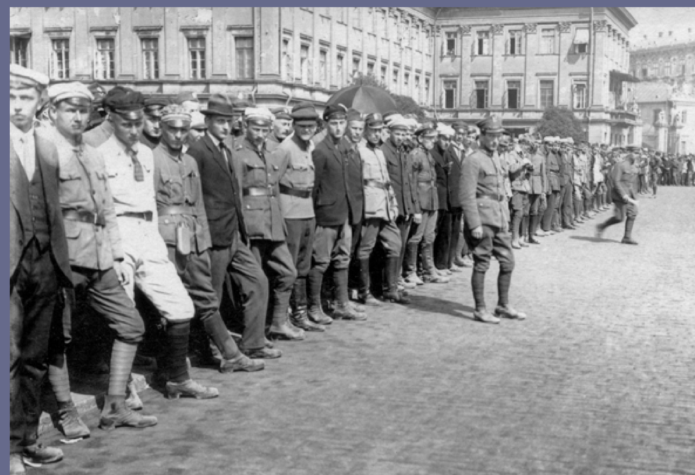
Ochotnicy, 18 lipca 1920, autor niezany, fot. ze zbiorów Muzeum Wojska Polskiego w Warszawie