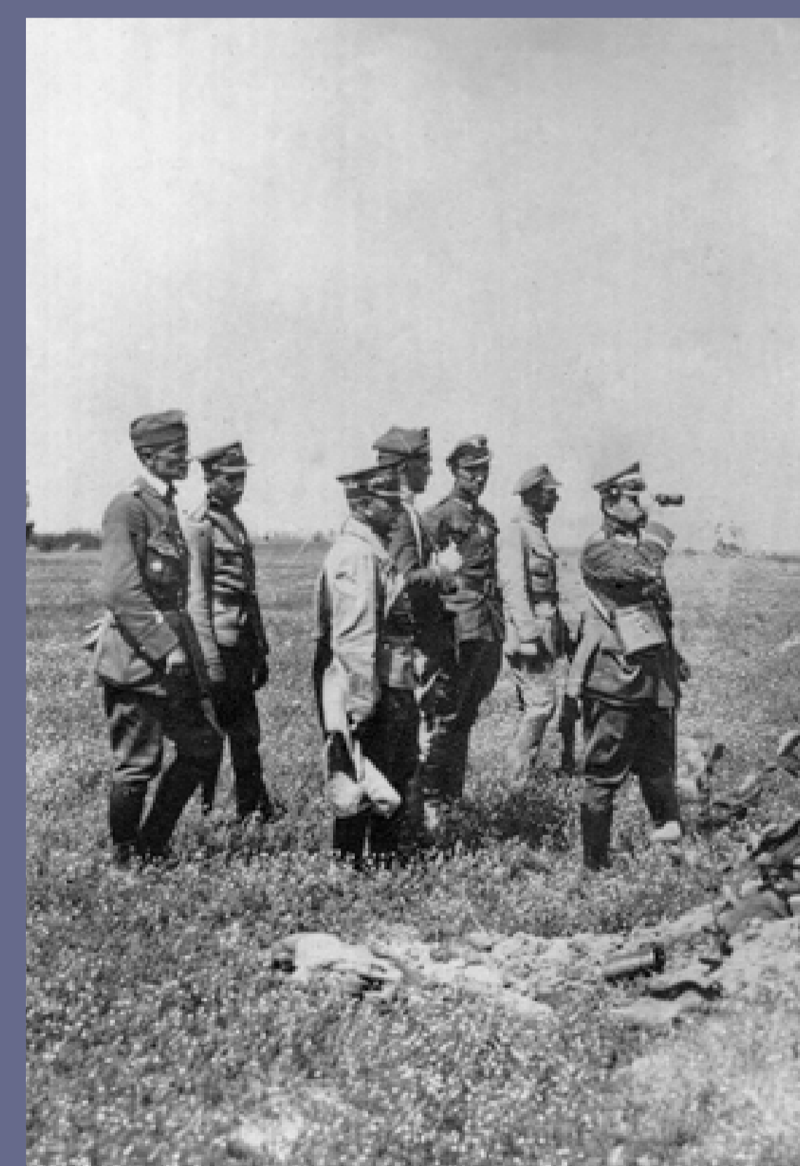
General Józef Haller pod Radzyminem, 1920, autor niezany, fot. ze zbiorów Muzeum Wojska Polskiego w Warszawie