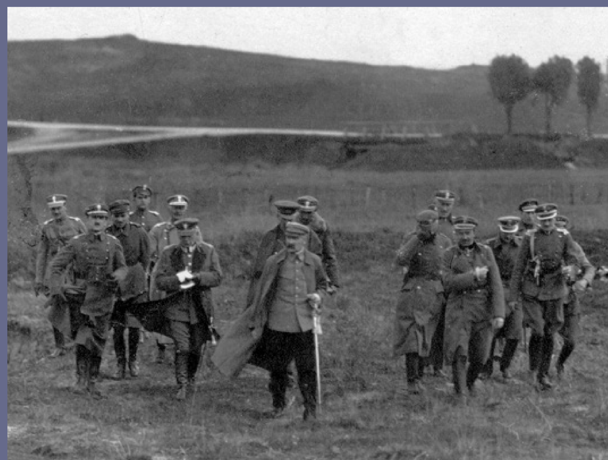
Wojna polsko-bolszewicka 1919–1921. Bitwa nad Niemnem, wrzesień 1921, autor niezany, fot. ze zbiorów Instytutu Pamięi Narodowej