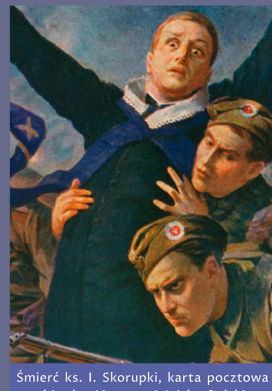
Śmierć ks. I. Skorupki, karta pocztowa ze zbiorów Muzeum Wojska Polskiego w Warszawie. Ks. Ignacy Skorupka zginął 14 sierpnia 1920 pod Ossowem jako kapłan Wojska Polskiego. Jego śmierć stała się jednym z symboli Bitwy Warszawskiej