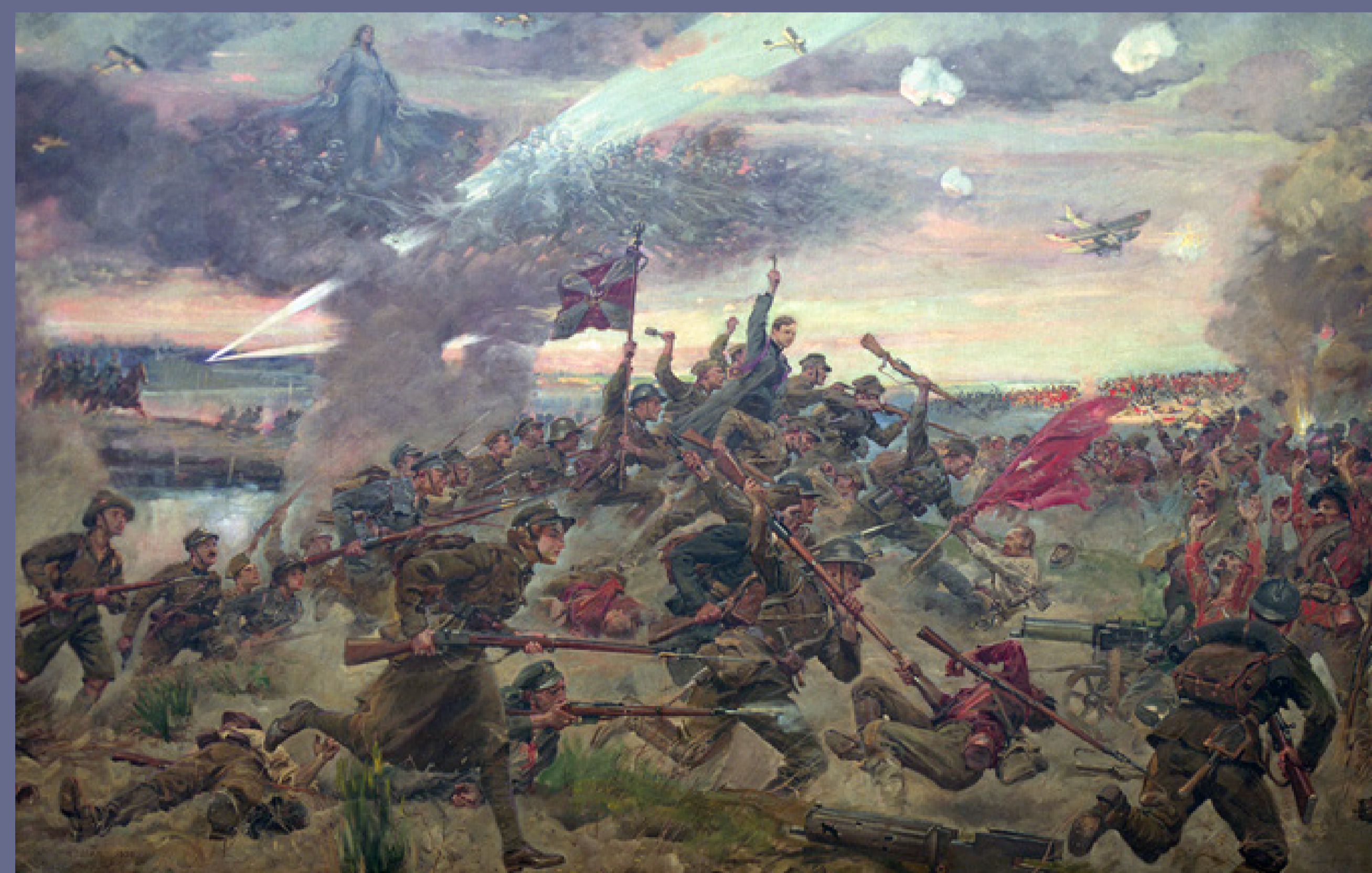
Obraz J. Kossaka, „Cud nad Wisłą”, 1930, ze zbiorów Muzeum Wojska Polskiego w Warszawie