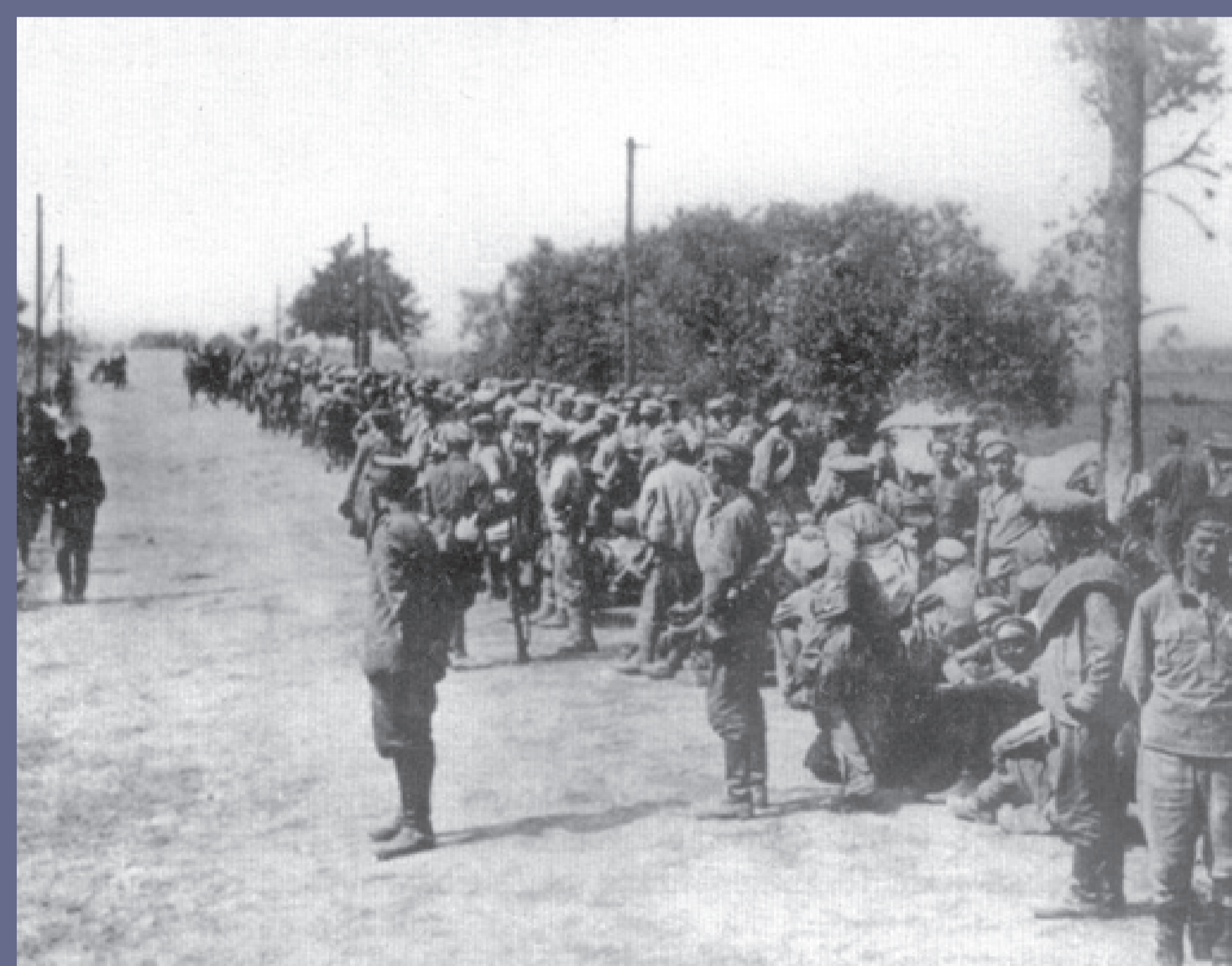
Jęcy bolszewicy wzięci do niewoli pod Radzyminem

Polskie zwycięstwo w wojnie położyło kres planom sowietyzacji Europy Środkowej i Zachodniej. Bitwa Warszawska, zwana też Cudem nad Wisłą, uznawana jest za jedną z najbardziej decydujących bitew świata. Karol Wojtyła już jako papież często wspominał to wydarzenie. Przypominał mu o nim obraz Jana Rosena „Cud nad Wisłą” zawieszony w pałacu papieskim w Castel Gandolfo.