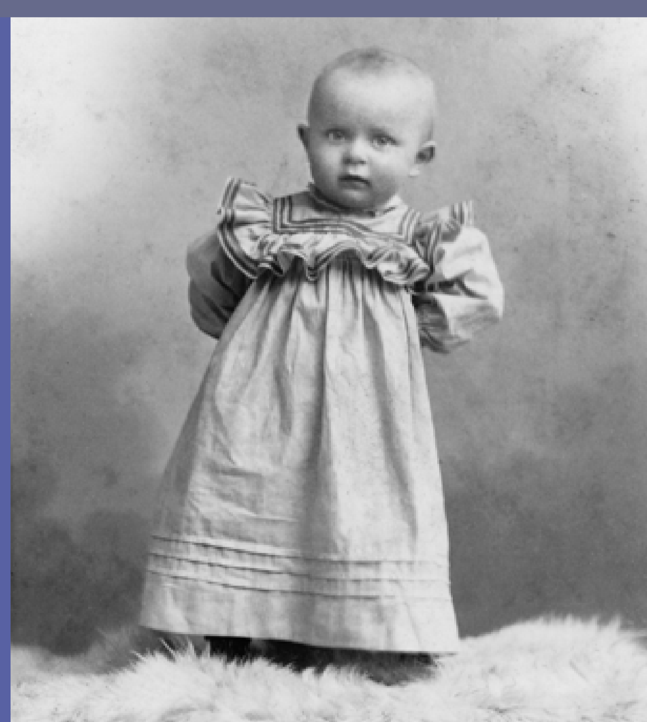
Karol Józef Wojtyła, ok. 1921

Gdy 18 maja 1920 roku, przy dźwiękach Litanii Loretańskiej urodził się Karol Wojtyła, w nowo odrodzonej Polsce trwała wojna. Pod Warszawę podchodziły właśnie oddziały Armii Czerwonej. Główną przyczyną wybuchu wojny polsko-bolszewickiej był sprzeciw wobec polskiej niepodległości ze strony Rosji bolszewickiej oraz próba wcielenia w życie idei permanentnej rewolucji i eksportu komunizmu na teren całej Europy.