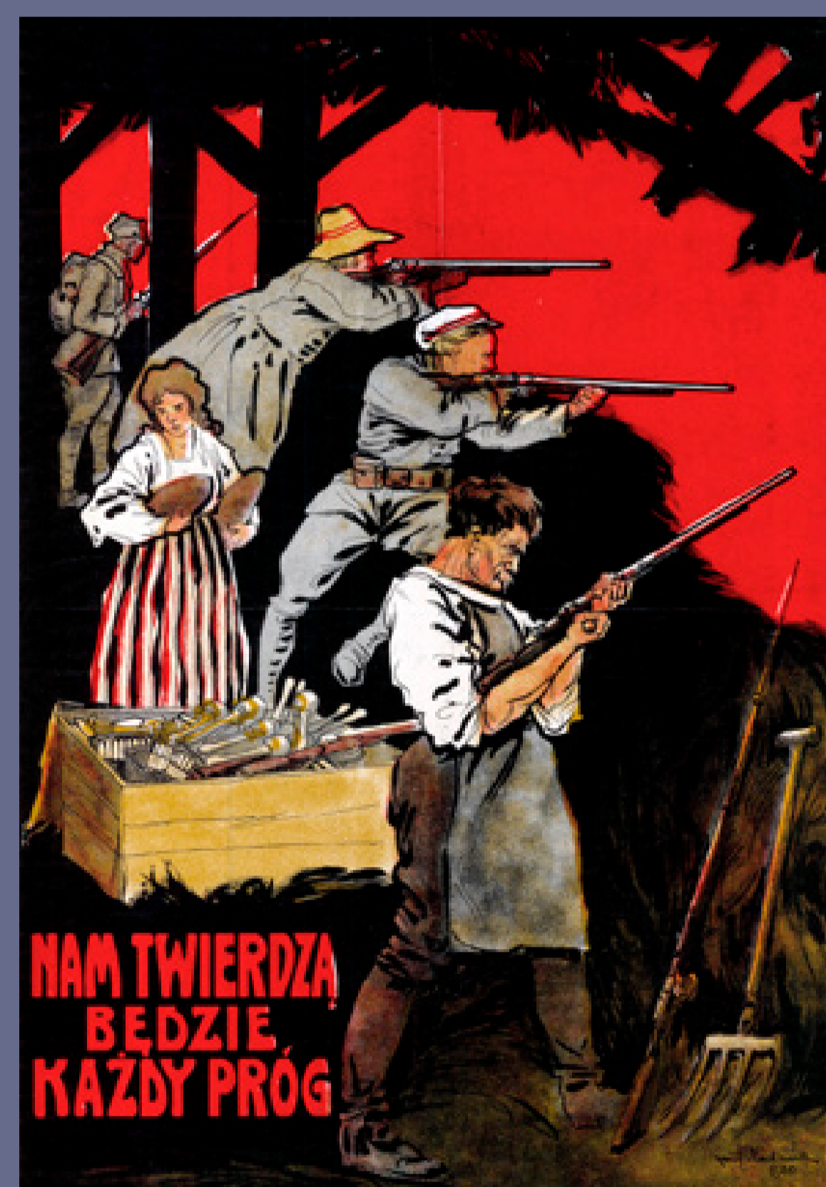
Plakat propagandowy „Nam twierdza będzie każdy próg”, Warszawa, 1920, autor: K. Mackiewicz