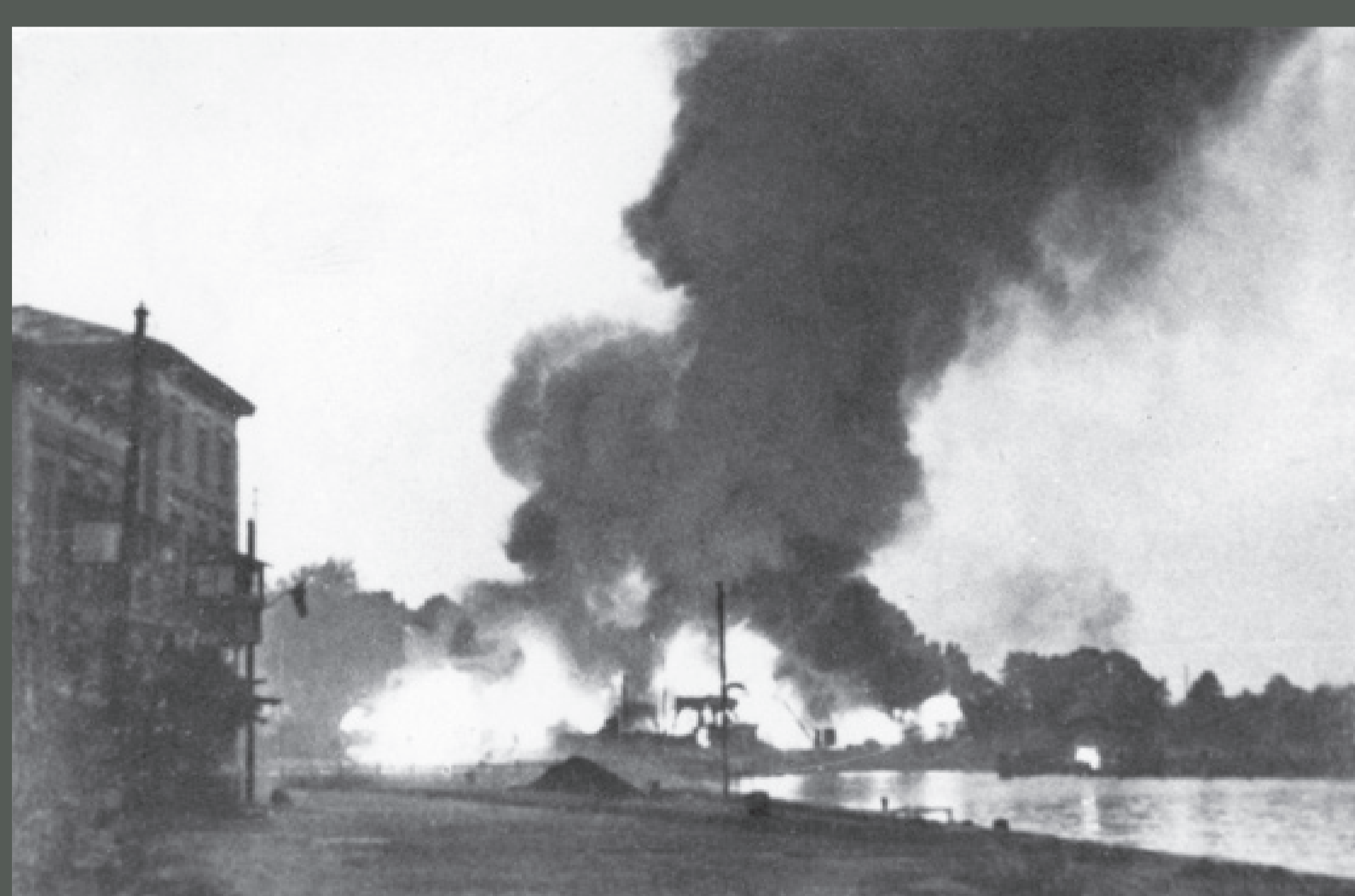
Plonąca po ostrzale niemieckim polska Wojskowa Składnica Tranzytowa na Westerlandzie, wrzesień 1939, autor nieznany, fot. ze zbiorów Instytutu Pamięci Narodowej