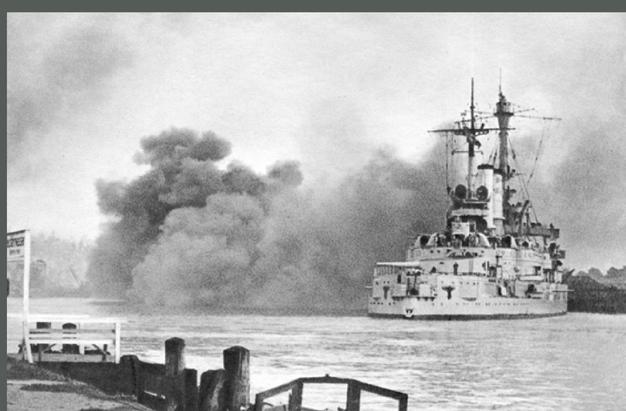
Niemiecki pancernik „Schleswig-Holstein” ostrzeliwuje polskie pozycje na Westerlandzie, 1 września 1939

W chwili wybuchu wojny Karol Wojtyła miał 19 lat. Od roku mieszkał wraz z ojcem w Krakowie, gdzie przeprowadzili się, aby młody Karol mógł studiować wymarzoną polonistykę. W 1939 roku zapisał się na drugi rok studiów. Hitlerowcy aresztowali większość pracowników Uniwersytetu Jagiellońskiego i nie dopuścili do rozpoczęcia nowego roku akademickiego. Wojtyła przerwał studia i rozpoczął pracę jako robotnik Zakładów Chemicznych Solvay. W 1941 roku zmarł ojciec Karola Wojtyły.