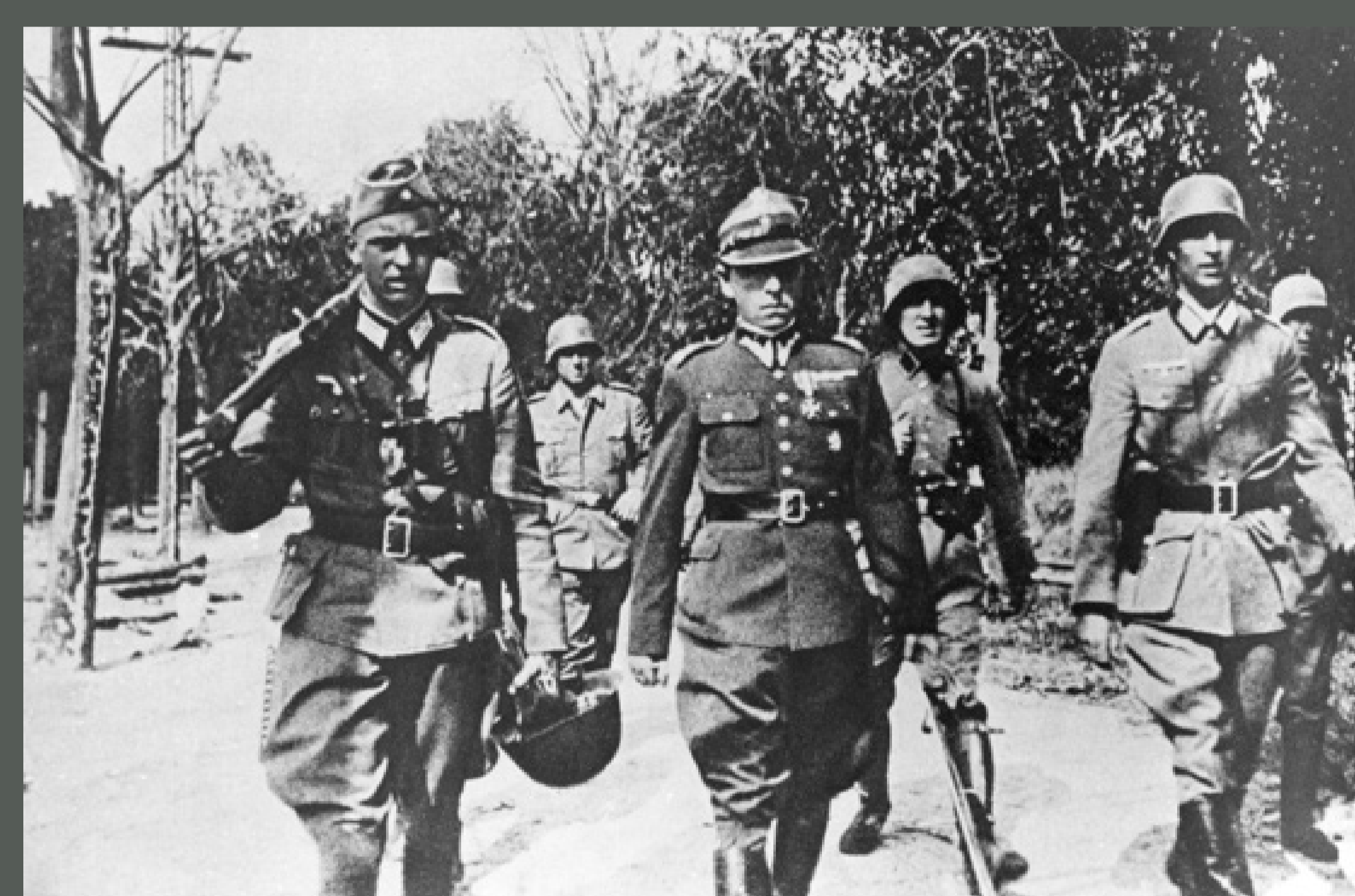
Dowódca obrony Westerlandzie major Henryk Sucharski prowadzony przez Niemców do niewoli. 7 września 1939