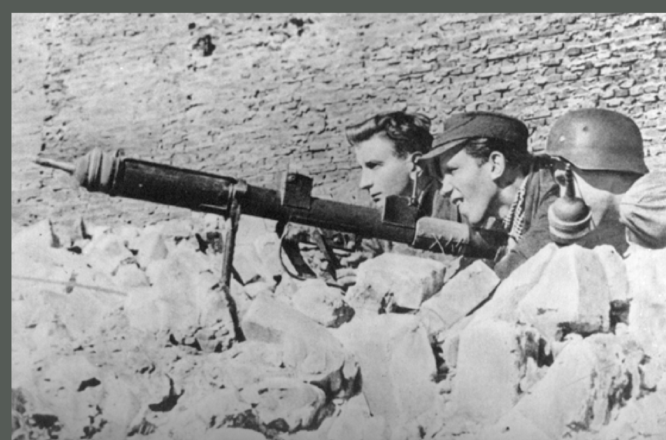
Powstanie Warszawskie, walki na Mokotowie. Warszawa, sierpień 1944, autor nieznany, fot. ze zbiorów Instytutu Pamięci Narodowej