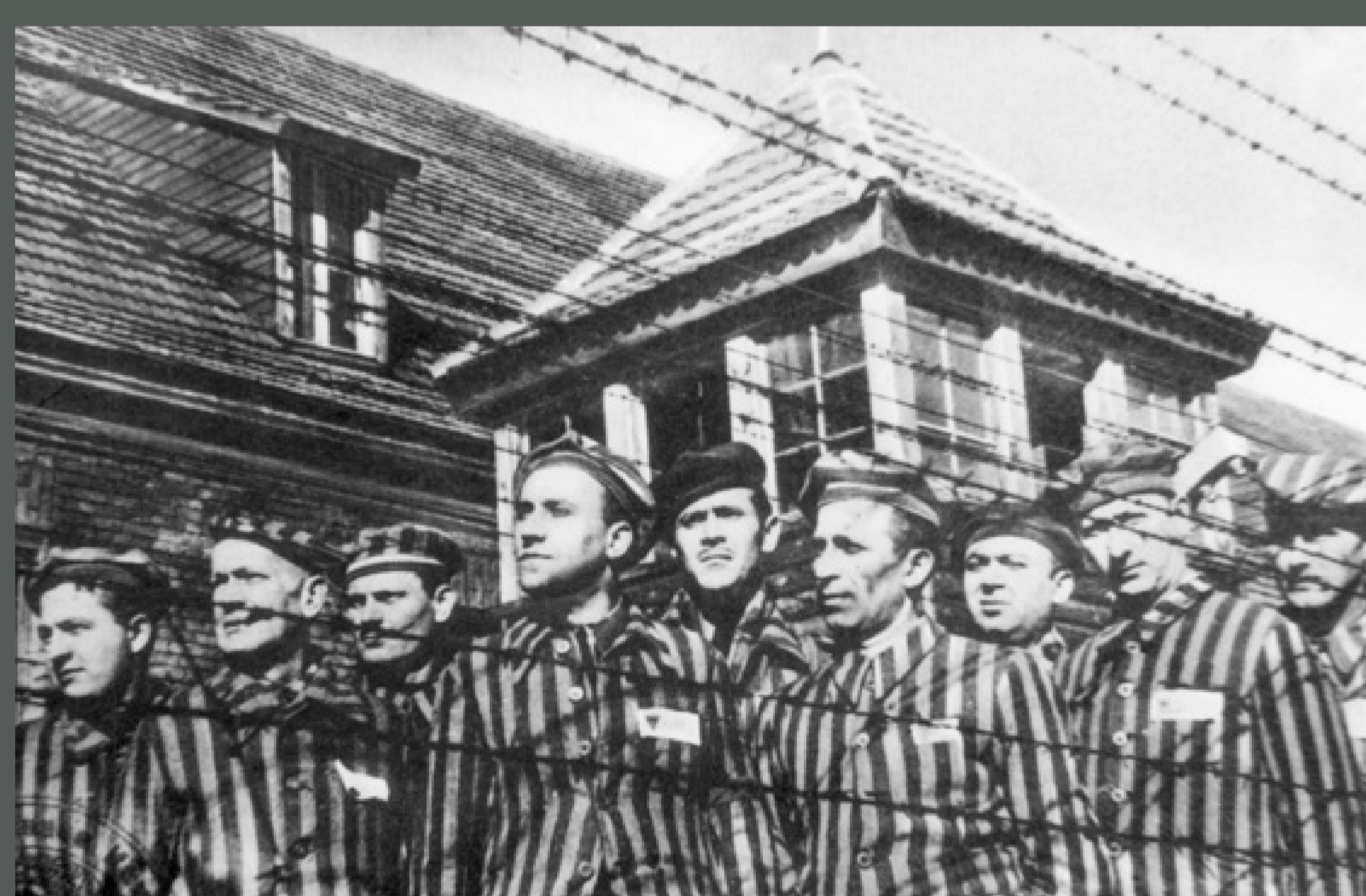
KL Auschwitz. Uwolnieni przez armię sowiecką więźniowie – oficerowie jugosłowiańscy. Oświęcim, styczeń 1945