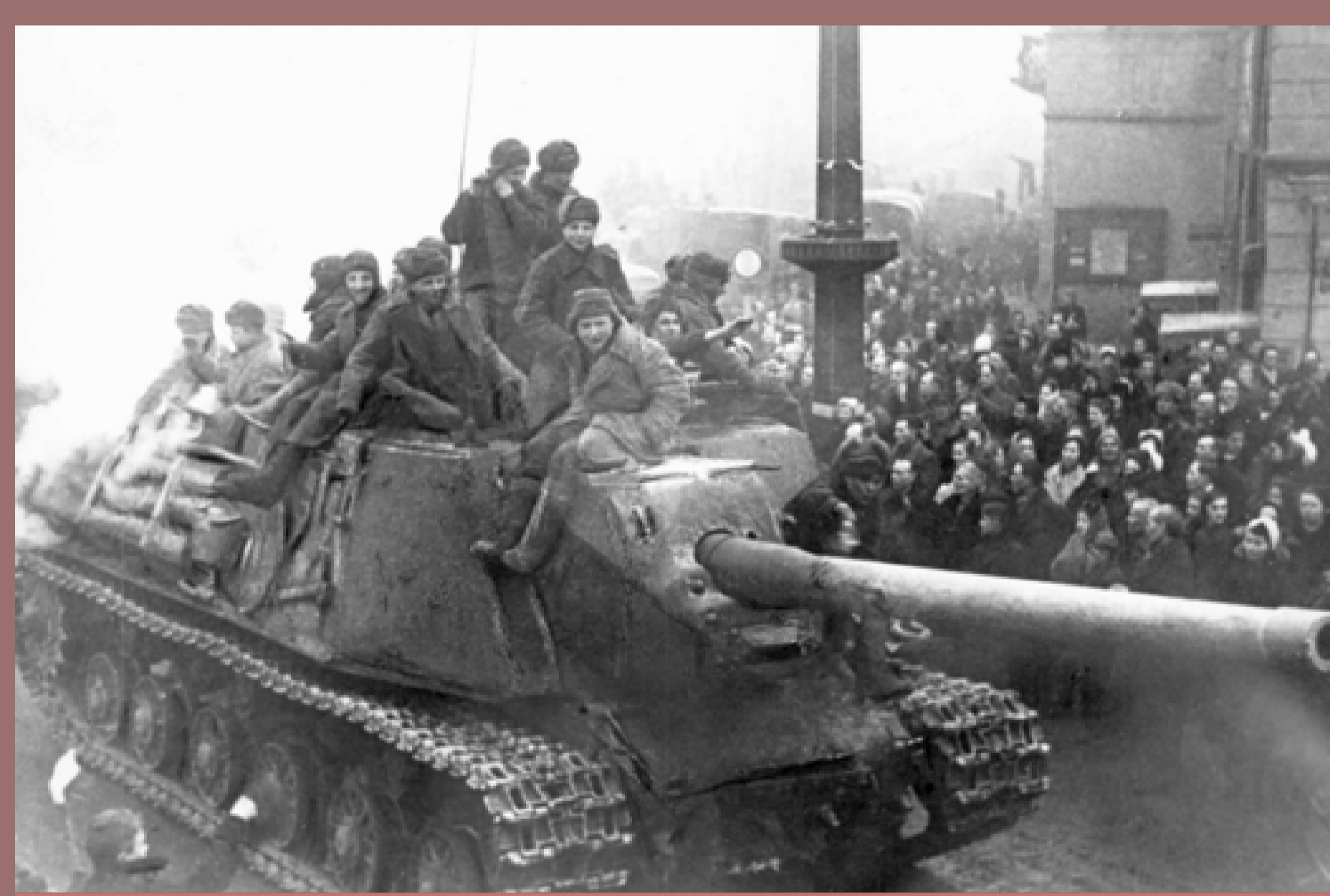
Wkroczenie wojsk sowieckich do Łodzi, luty 1945, zdjęcie propagandowe