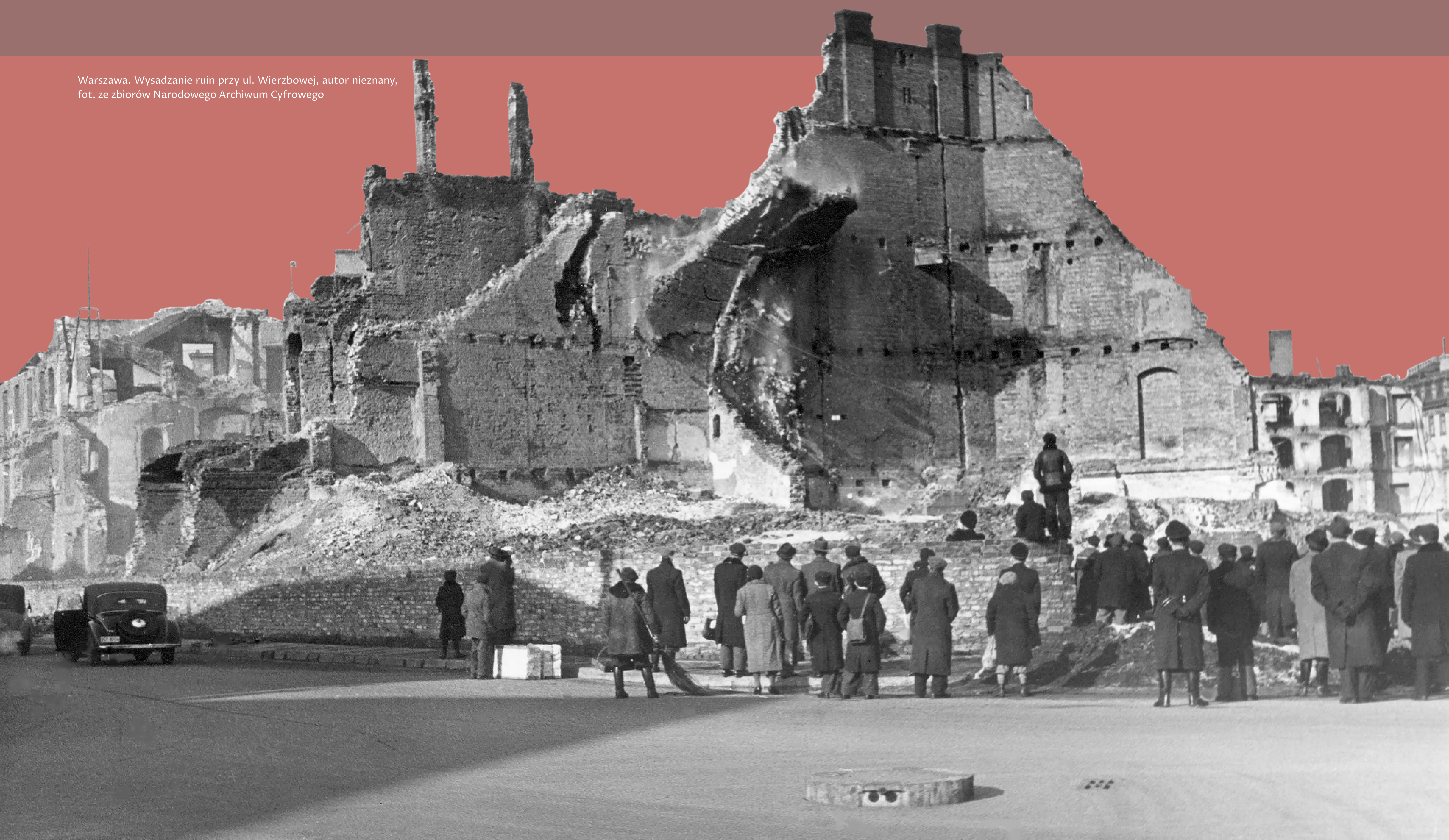
Warszawa. Wysadzanie ruin przy ul. Wierzbowej, autor nieznany, fot. ze zbiorów Narodowego Archiwum Cyfrowego