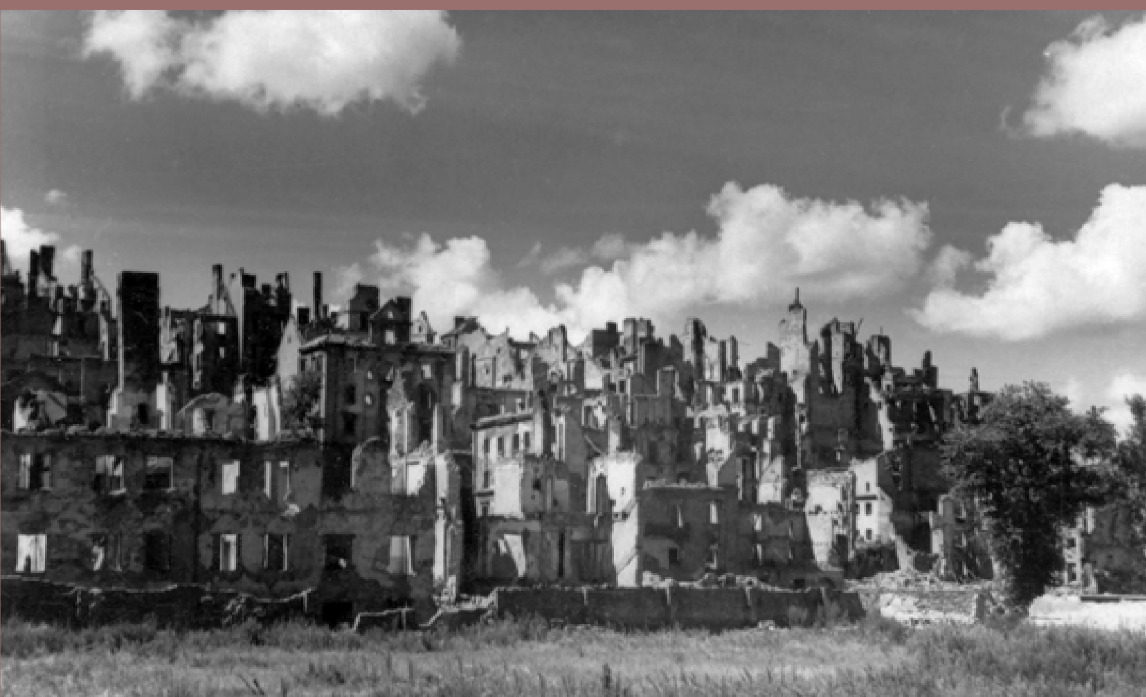
Zniszczona przez Niemców Warszawa. Panorama Starego Miasta od strony Wisły, lipiec 1945

W 1946 roku, w dzień Wszystkich Świętych, Karol Wojtyła przyjął święcenia kapłańskie z rąk kard. Adama Sapiehy. 2 listopada trzy Msze prymicyjne odbyły się w romańskiej krypcie św. Leonarda na Wawelu. Krótko po święceniach ks. Karol wyjechał na studia do Rzymu. Po powrocie w 1948 roku został wikariuszem w swojej pierwszej parafii w Niegowici.