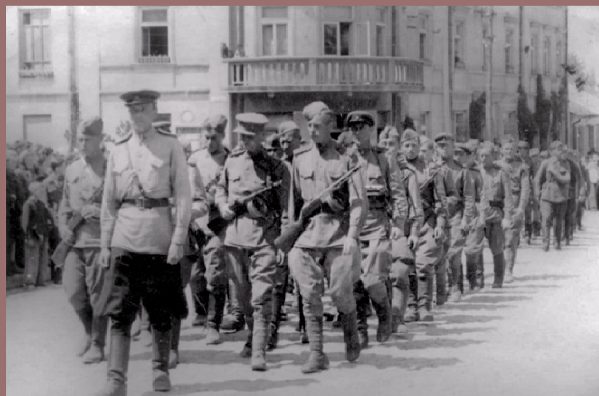
Demonstracja siły Armii Czerwonej podczas pogrzebu oficerów sowieckich zlikwidowanych przez polskie podziemie niepodległościowe. Zdjęcie propagandowe, ok. 1946