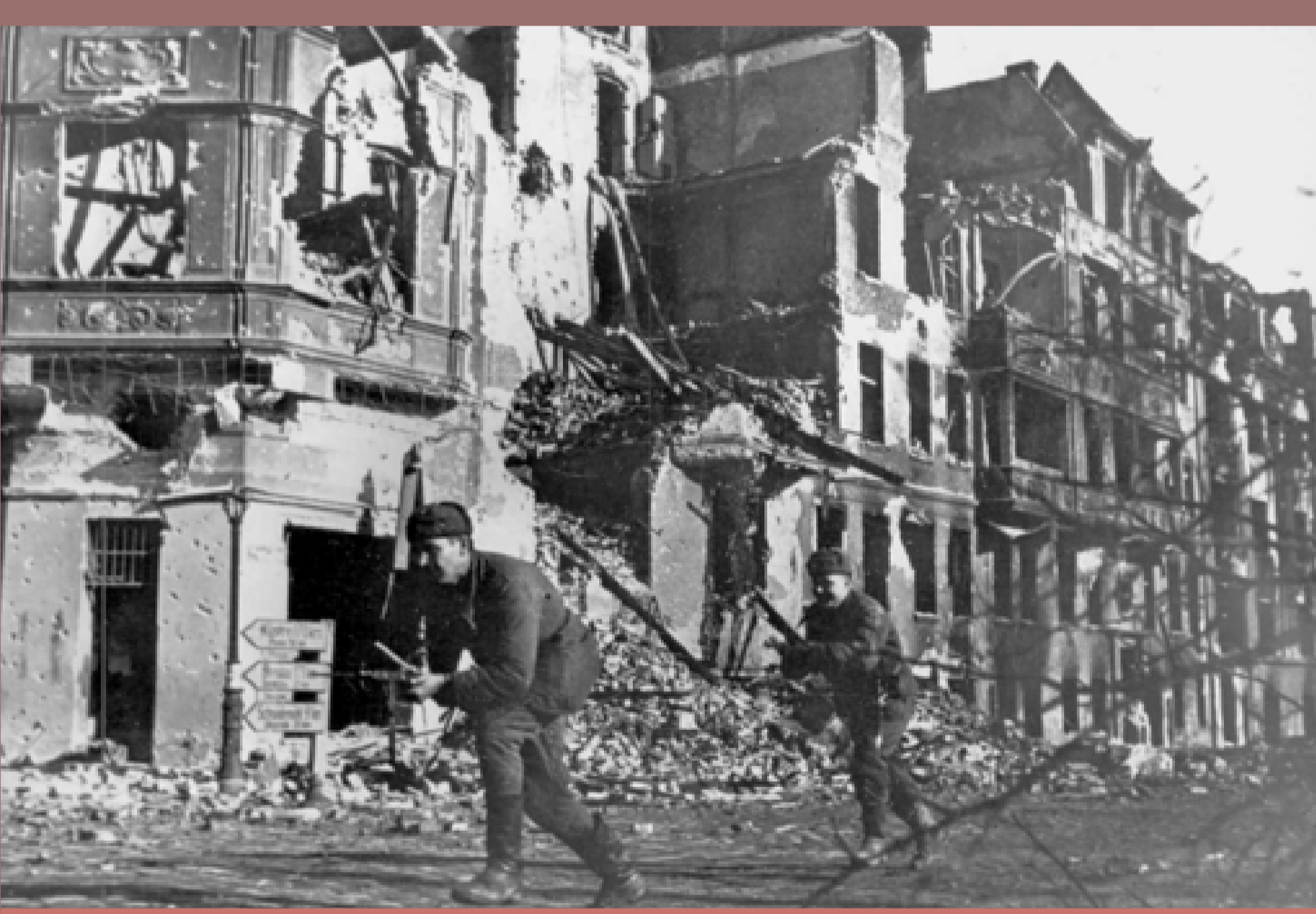
Wkroczenie wojsk sowieckich do Poznania, luty 1945, zdjęcie propagandowe