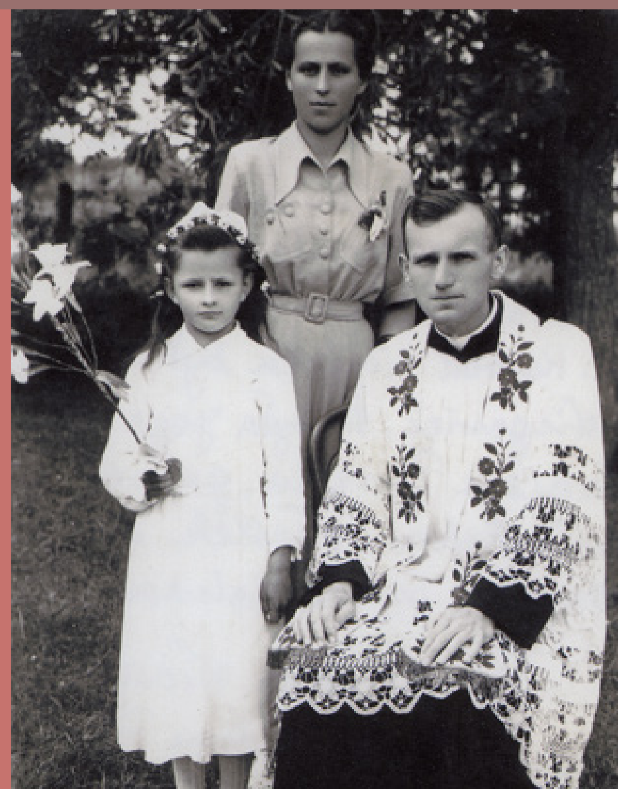
Ksiądz Karol Wojtyła jako wikary w parafii Niegowić, 11 czerwca 1949

Okres po 1945 roku to czas, gdy Europa była cała w gruzach, osłabiona i rozdarta między dwoma przeciwstawnymi globalnymi mocarstwami, Stanami Zjednoczonymi Ameryki i Związkiem Radzieckim. Zjednoczone strachem przed komunizmem, niektóre państwa Europy Zachodniej wkroczyły na drogę współpracy na szczeblu ponadnarodowym, aby zdławić nacjonalizm i wykluczyć ryzyko kolejnej wojny. Niestety, w Europie Wschodniej dla wielu ludzi wyzwolenie oznaczało zastąpienie tyranii nazistowskiej komunistyczną dyktaturą pod kontrolą sowiecką.