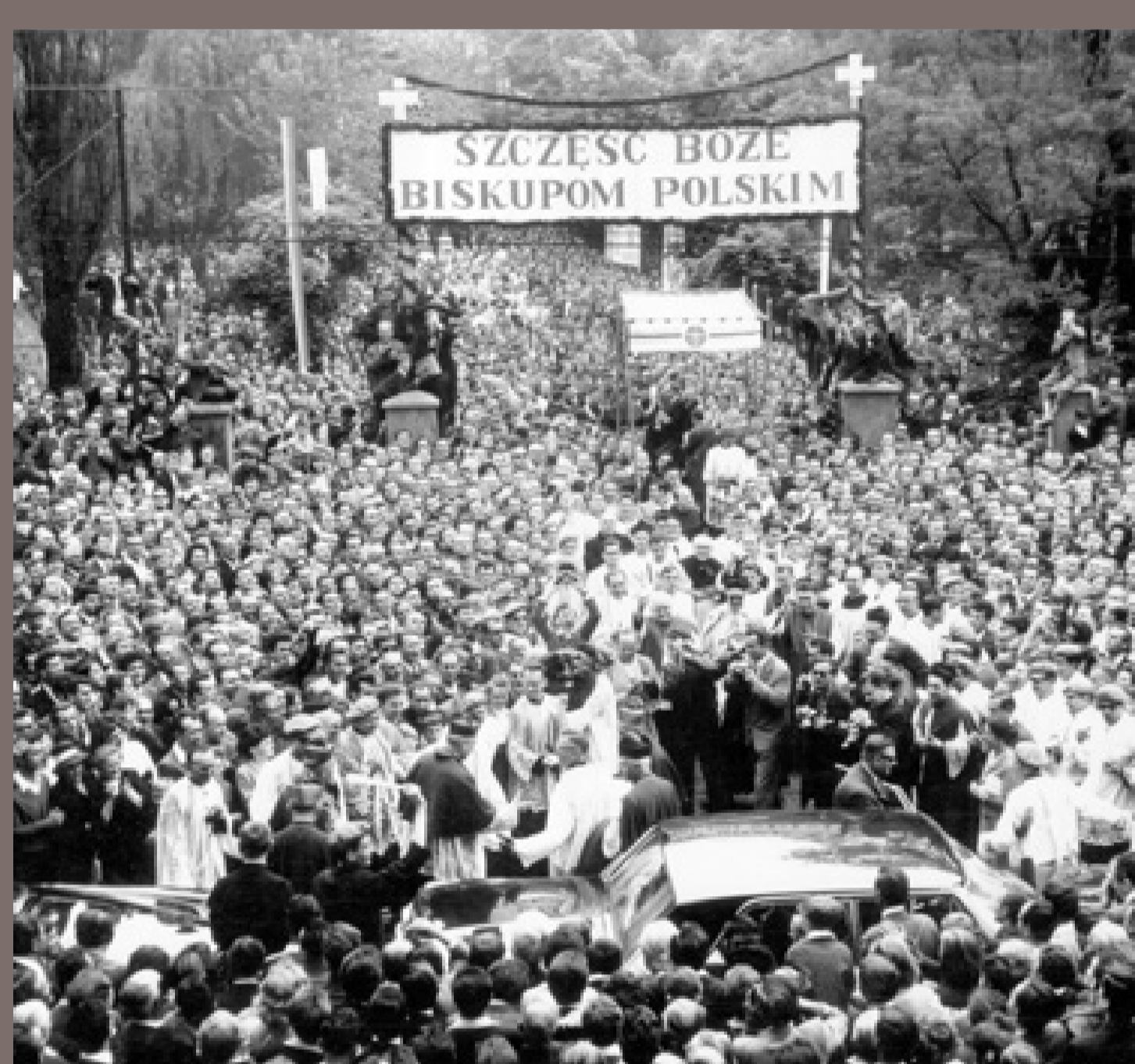
Obchody Milenium Chrztu Polski w Piekarach Śląskich. Powitanie Prymasa Stefana Wyszyńskiego przed wejściem do Sanktuarium Matki Boskiej Piekarskiej. 22 maja 1966 r.

W równym stopniu był on obiektem religijnego kultu, jak i symbolem wolnej Polski. Arcybiskup metropolita krakowski Karol Wojtyła bardzo aktywnie angażował się w przygotowania do obchodów Milenium Chrztu Polski, których kulminacyjny moment miał miejsce na Jasnej Górze 3 maja 1966 roku.