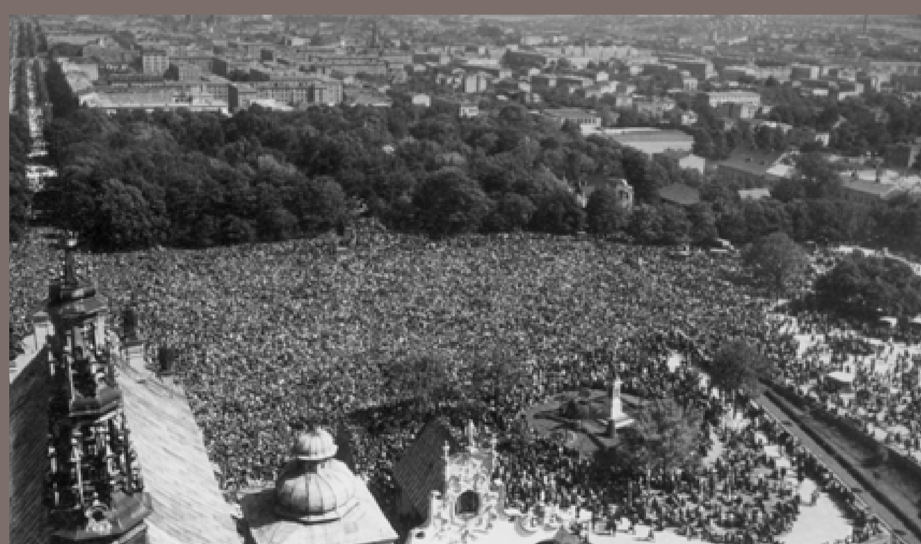
Obchody Milenium Chrztu Polski w Częstochowie. Wierni na błoniach jasnogórskich. Zdjęcie SB. 3 maja 1966, autor nieznany, fot. ze zbiorów Instytutu Pamięi Narodowej