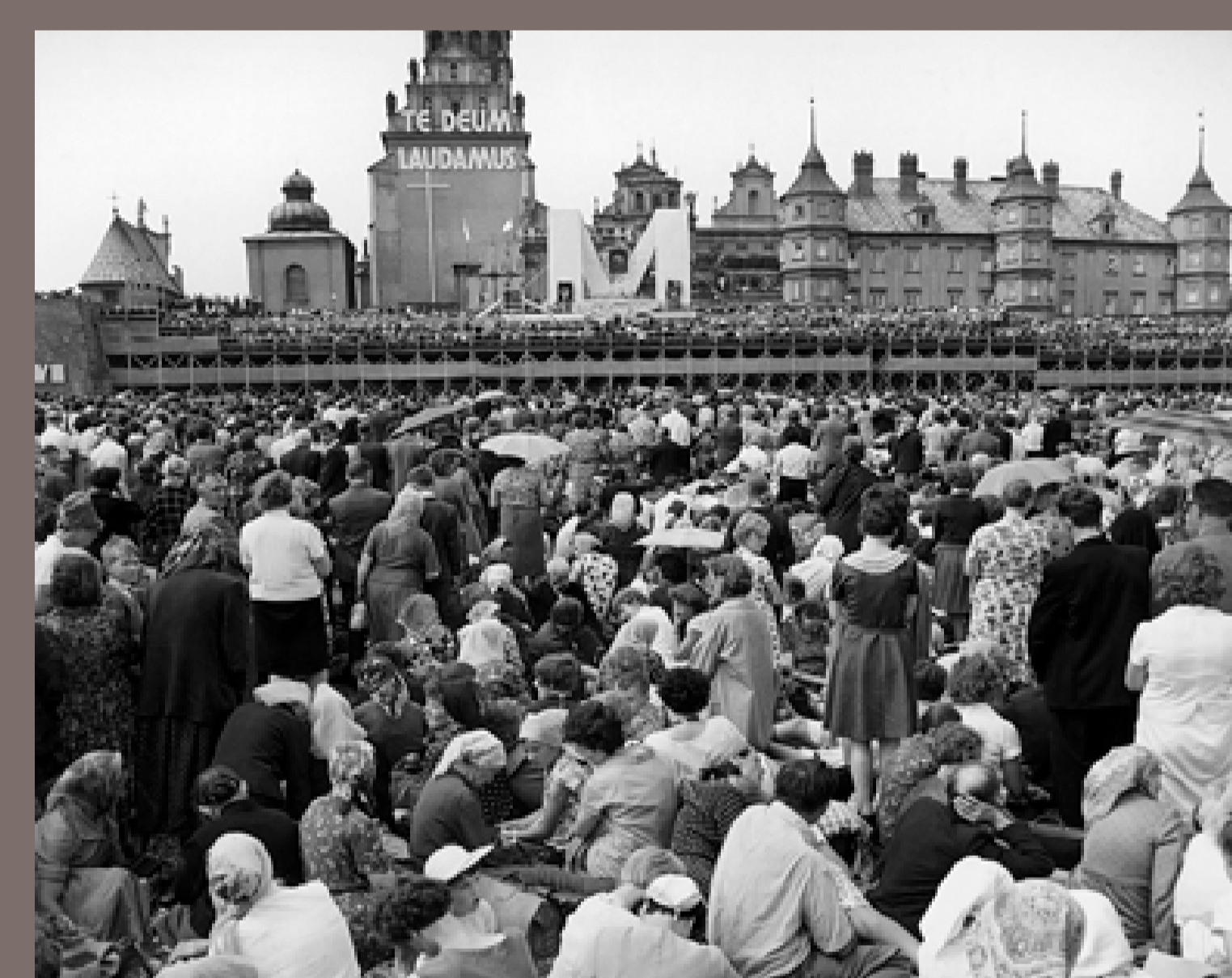
Obchody Tysiąclecia Chrztu Polski w Częstochowie, klasztor oo. Paulinów na Jasnej Górze