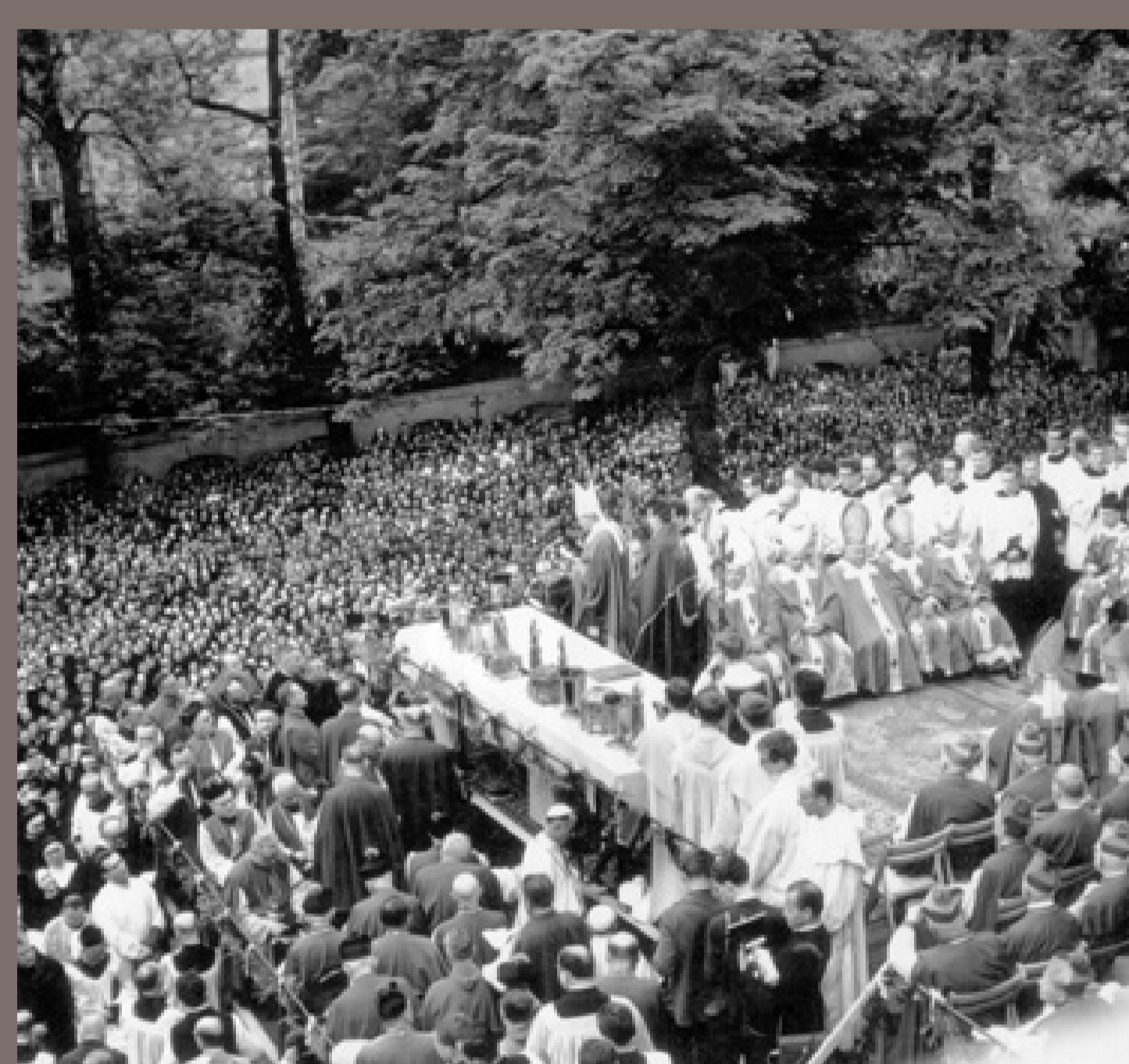
Obchody Milenium Chrztu Polski w Krakowie. Kościół oo. Paulinów na Skalce. Zdjęcie SB. 8 maja 1966, autor nieznany, fot. ze zbiorów Instytutu Pamięi Narodowej