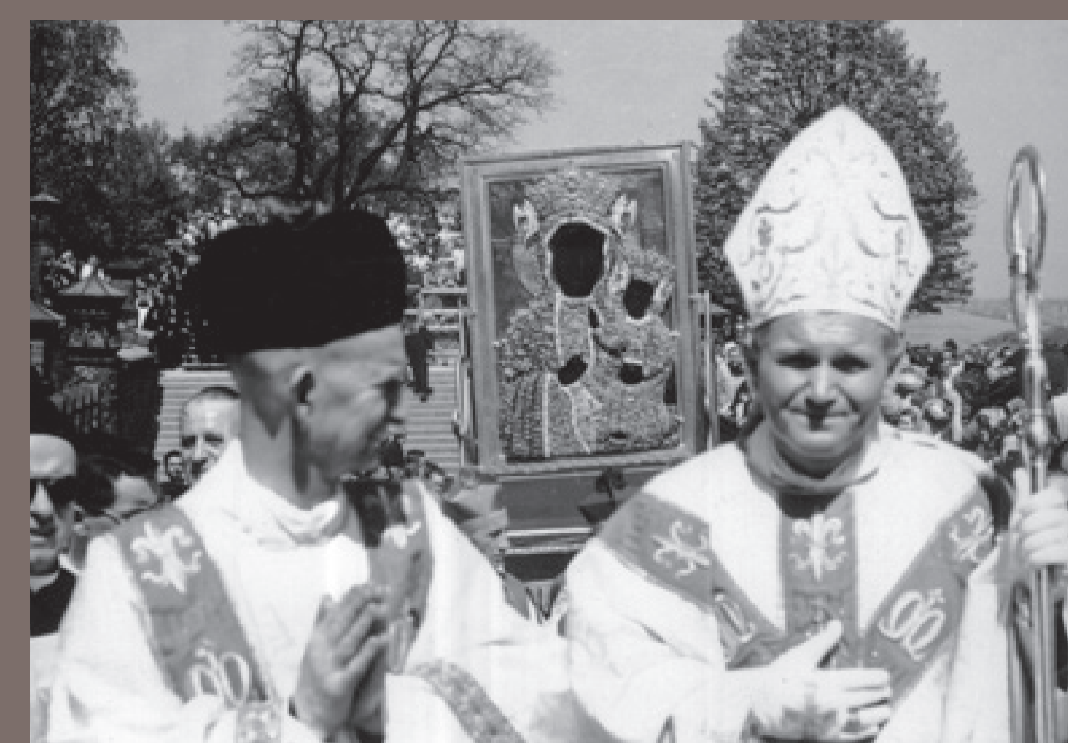
Obchody Milenium Chrztu Polski w Częstochowie. Procesja na wałach klasztoru oo. Paulinów. Zdjęcie SB. 3 maja 1966, autor nieznany, fot. ze zbiorów Instytutu Pamięi Narodowej