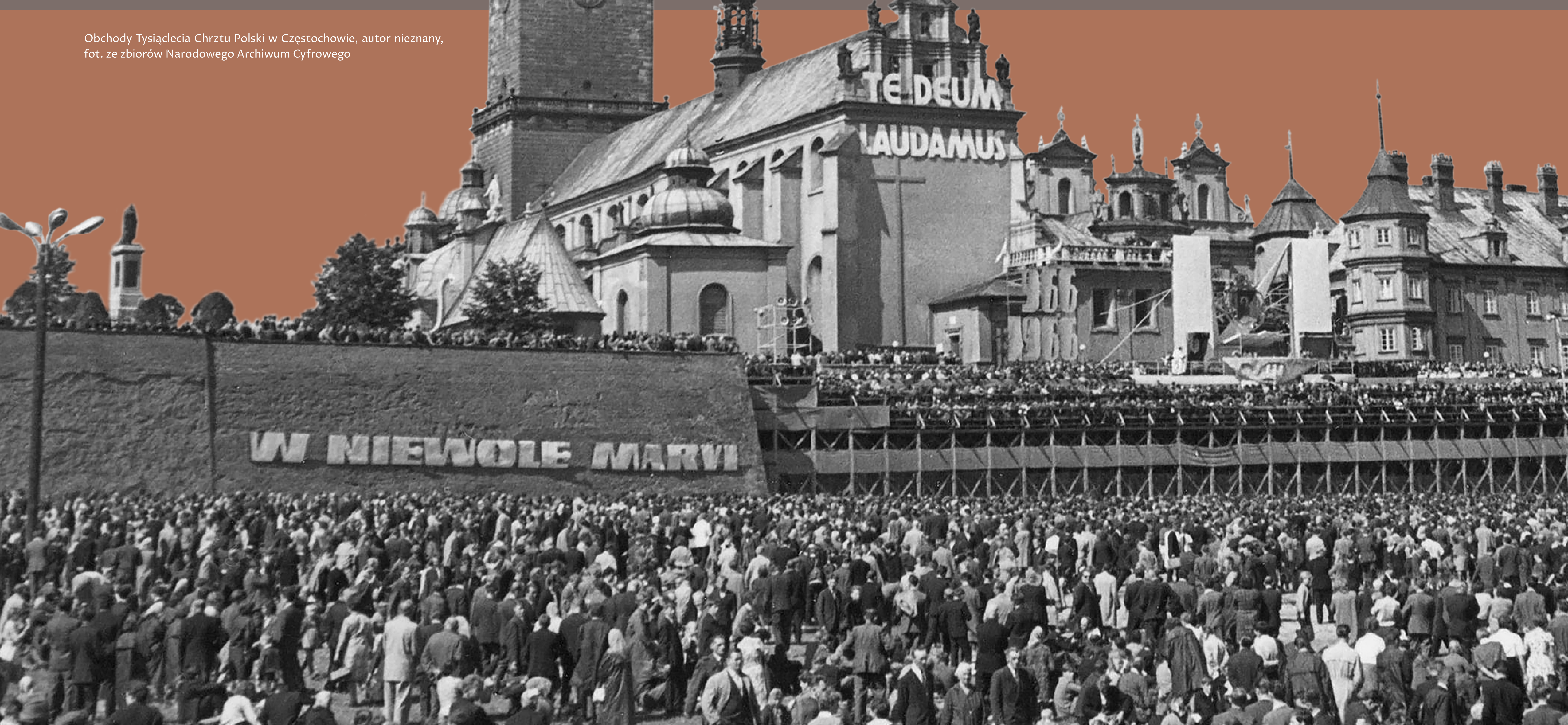
Obchody Tysiąclecia Chrztu Polski w Częstochowie, autor nieznany, fot. ze zbiorów Narodowego Archiwum Cyfrowego