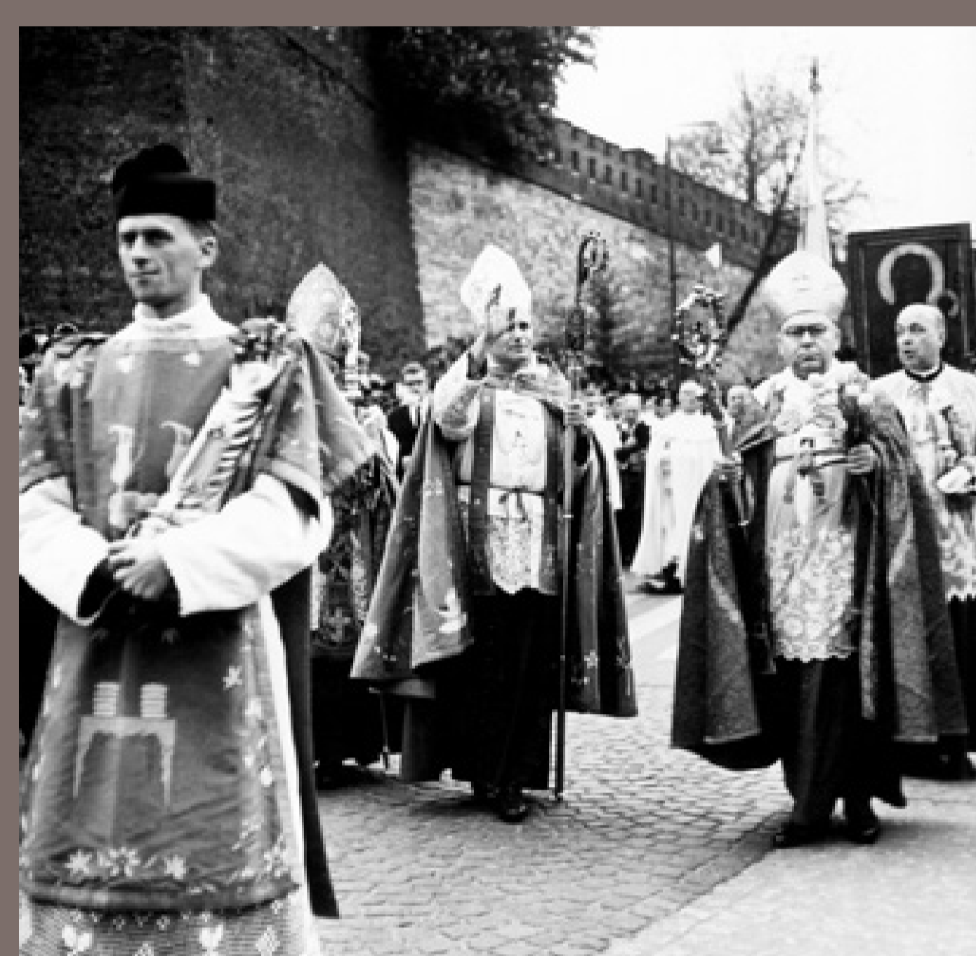
Obchody Milenium Chrztu Polski w Krakowie. Procesja z Katedry na Wawelu do kościoła oo. Paulinów na Skalce, widoczni biskupi Karol Wojtyła i Bolesław Kominek. Zdjęcie SB. 8 maja 1966