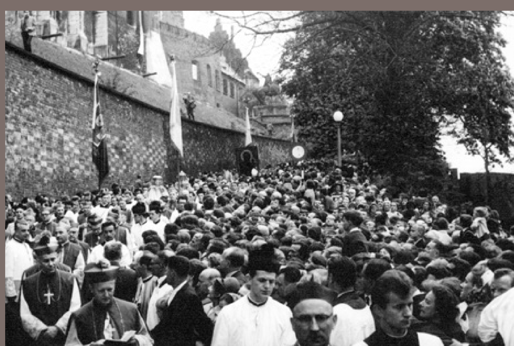
Obchody Milenium Chrztu Polski w Krakowie. Procesja z Katedry na Wawelu do kościoła oo. Paulinów na Skalce. Zdjęcie SB. 8 maja 1966, autor nieznany, fot. ze zbiorów Instytutu Pamięi Narodowej