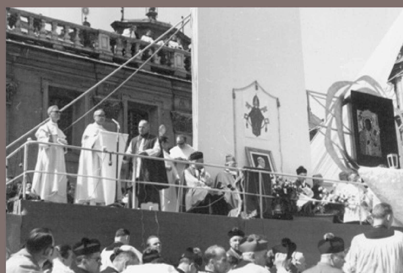
Obchody Milenium Chrztu Polski w Częstochowie. Msza św. rekoronacyjna. Na tronie papieskim obraz Pawła VI, którego władze komunistyczne nie wpuściły do Polski. Zdjęcie SB. 3 maja 1966, autor nieznany, fot. ze zbiorów Instytutu Pamięi Narodowej