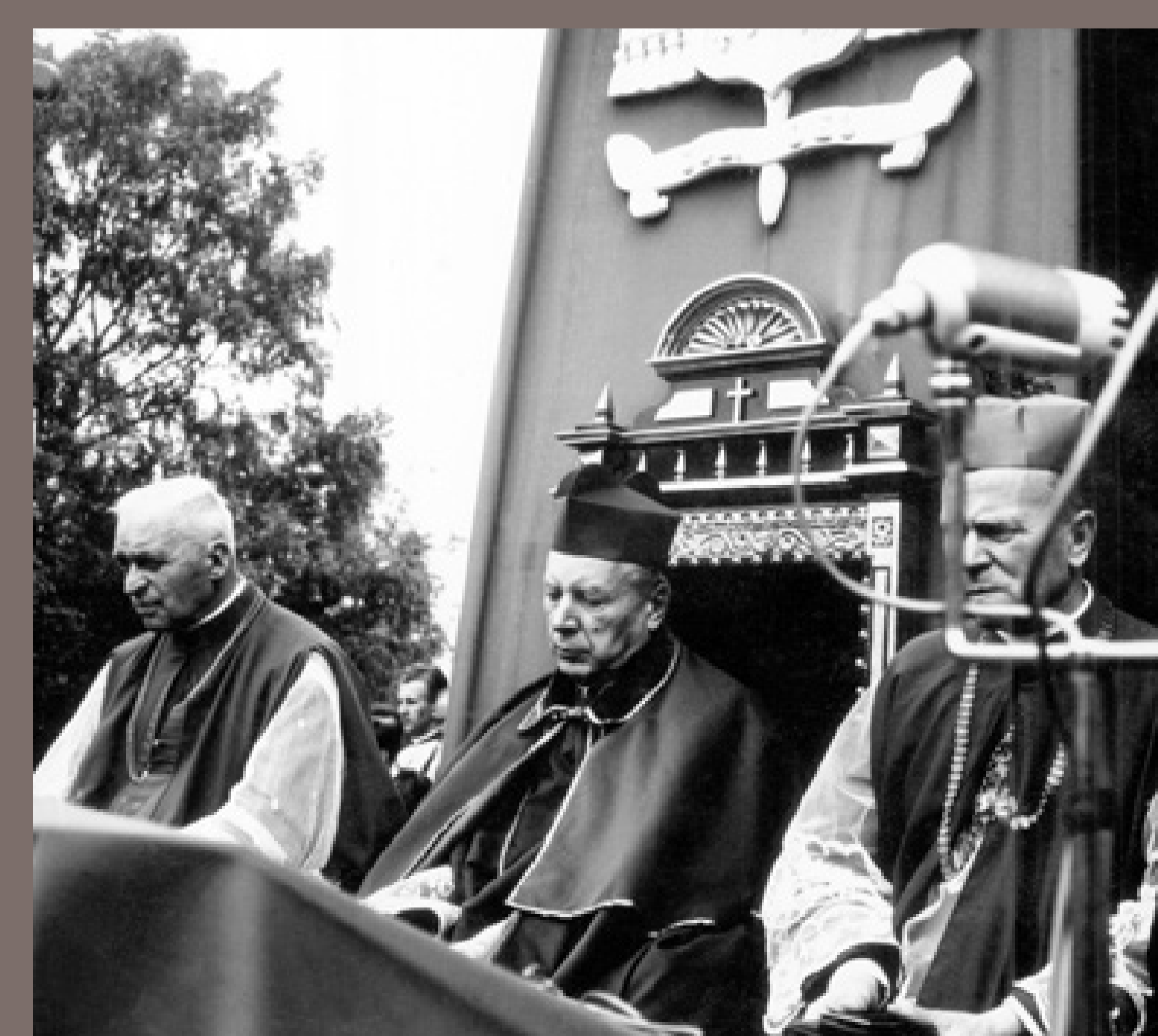
Obchody Milenium Chrztu Polski w Piekarach Śląskich. Zdjęcie SB. 22 maja 1966, autor nieznany, fot. ze zbiorów Instytutu Pamięi Narodowej