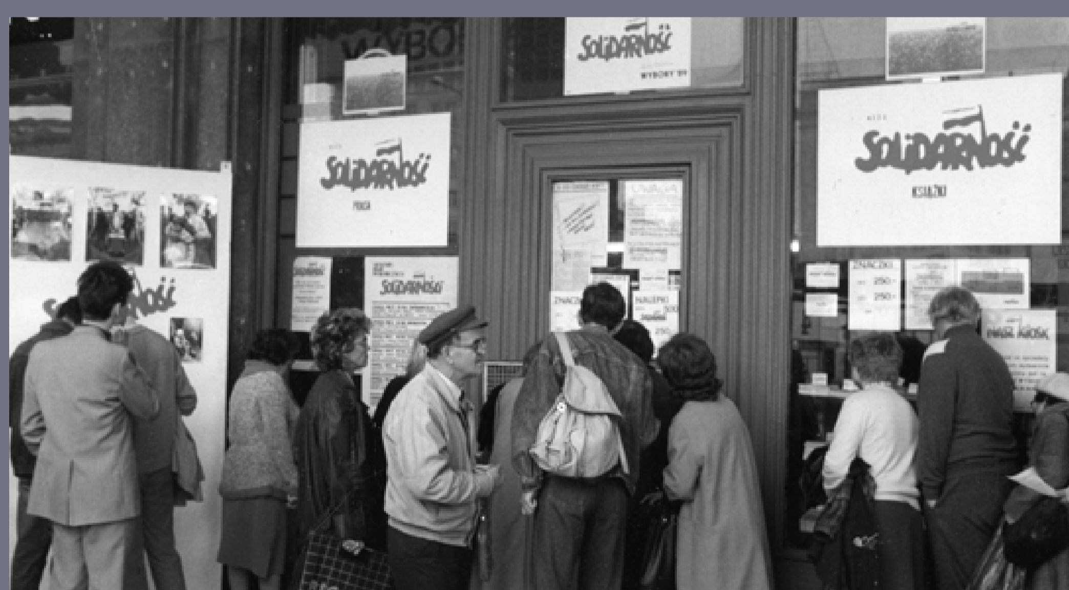
Kampania wyborcza do Sejmu i Senatu. Słupsk, 1989, autor nieznany, fot. ze zbiorów Instytutu Pamięci Narodowej