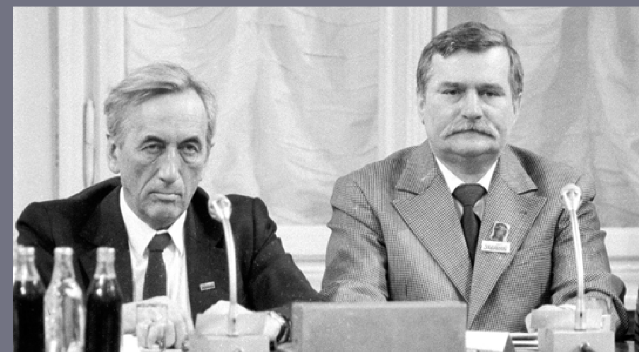
Obrady Okrągłego Stołu. Tadeusz Mazowiecki – działacz katolicki i doradca „Solidarności” i Lech Wałęsa, 1989