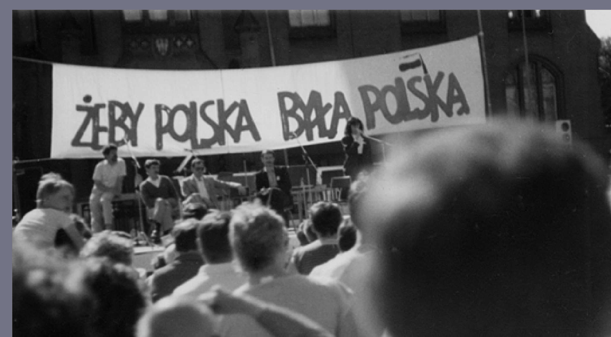
Kampania wyborcza do Sejmu i Senatu. Kandydaci NSZZ „Solidarność”. Słupsk, 1989, autor nieznany, fot. ze zbiorów Instytutu Pamięci Narodowej