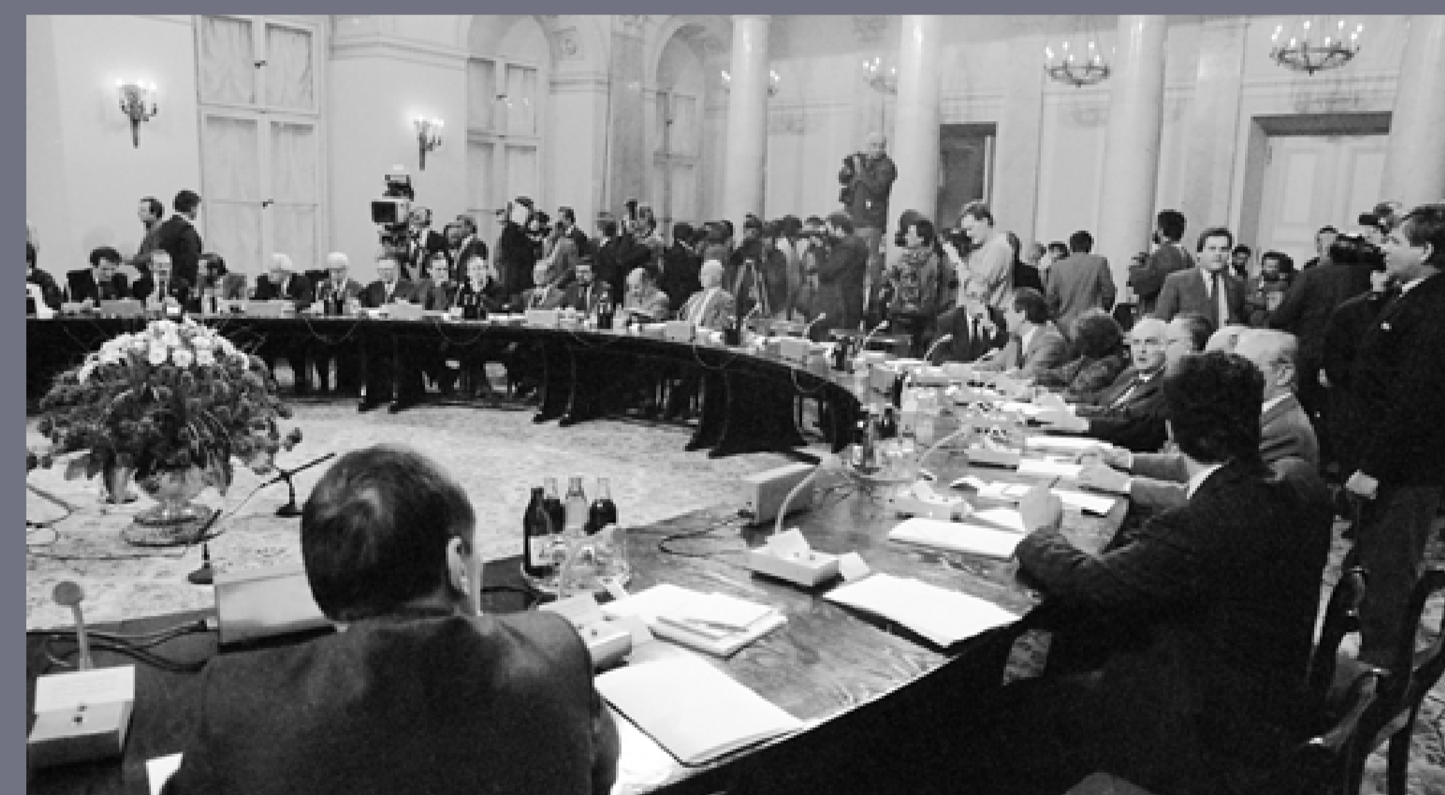
Obrady Okrągłego Stołu, Warszawa 1989, autor: Maciej Laprus, fot. z kolekcji agencji fotograficznej Fotonova