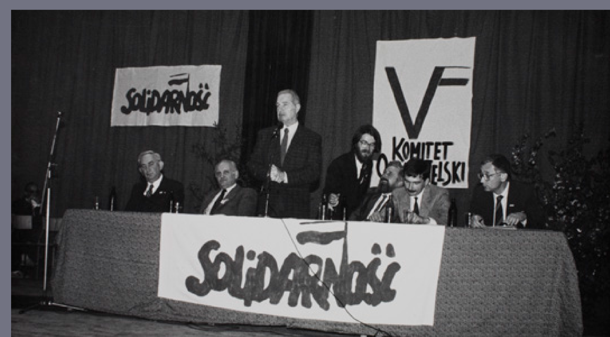
Spotkanie mieszkańców Ustrzyk Dolnych z kandydatami Komitetu Obywatelskiego „Solidarność” do Sejmu i Senatu, 5 maja 1989, autor nieznany, fot. ze zbiorów Instytutu Pamięci Narodowej