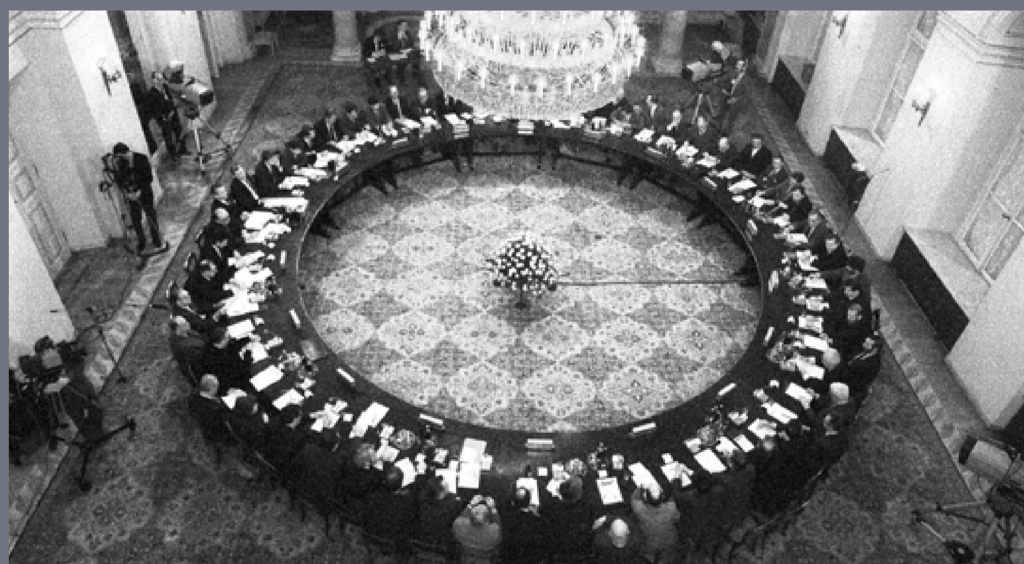
Obrady Okrągłego Stołu, Warszawa 1989

Jan Paweł II jako papież wspierał tę bezkrwawą rewolucję w swoim ojczystym kraju. Formę dziękczynienia za wyzwolenie z komunizmu miała miejsce jego podwójna pielgrzymka do Polski w 1991 roku. W czerwcu papież odwiedził liczne miasta od Bałtyku po Tatry, przypominając o wartościach, na których powinno budować się państwo i społeczeństwo wyzwolone spod jarzma komunizmu. Natomiast w sierpniu tego samego roku w Częstochowie odbyły się Światowe Dni Młodzieży, po raz pierwszy gromadząc tak liczną reprezentację młodych ludzi z byłego już bloku wschodniego.